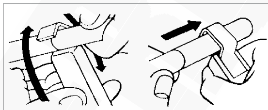
Zdejmowanie izolacji z „konca” kabla