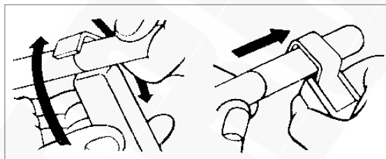
Zdejmowanie izolacji z „konca” kabla